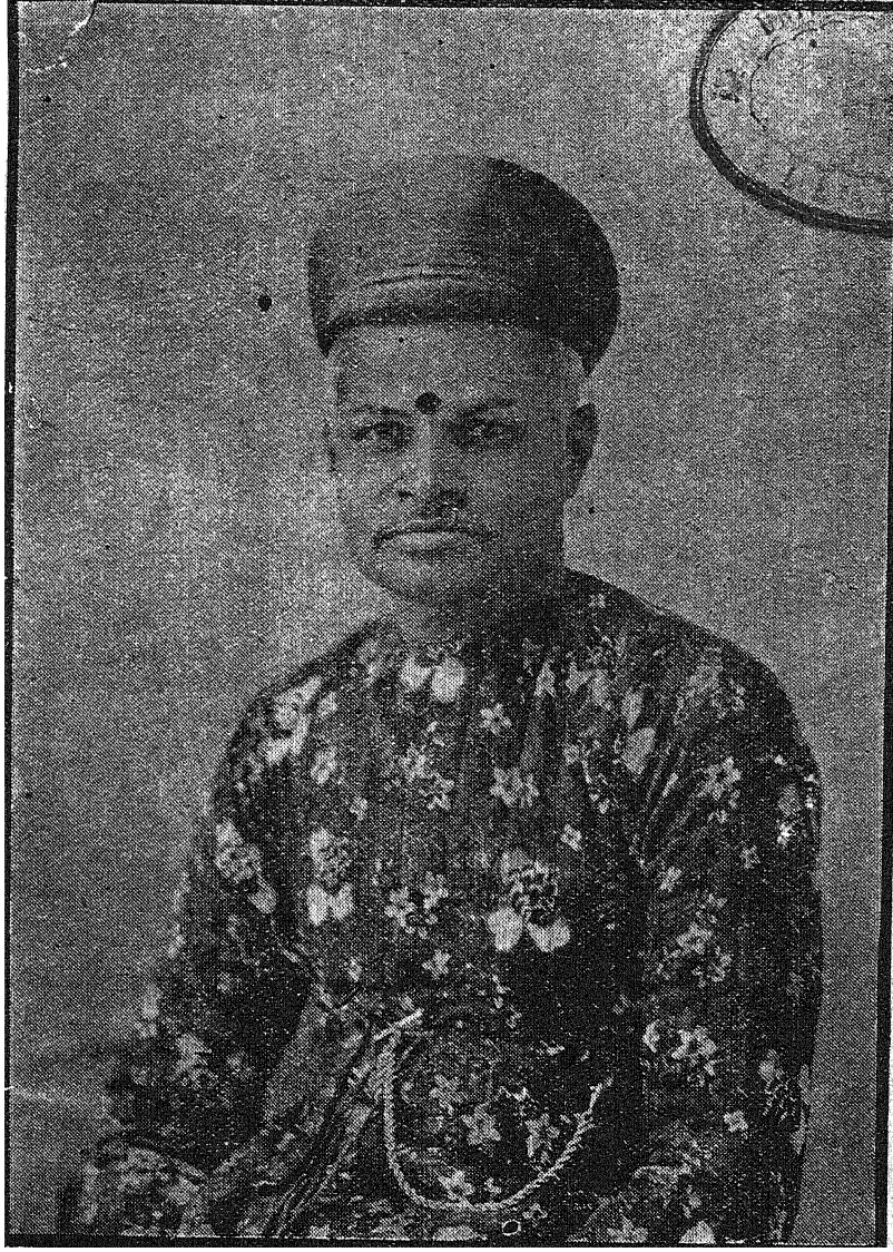
समीक्षाचक्रवर्ती स्वर्गीय पं. मधुसूदनजी ओझा विद्यावाचस्पति !